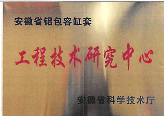
工程技术研究中心