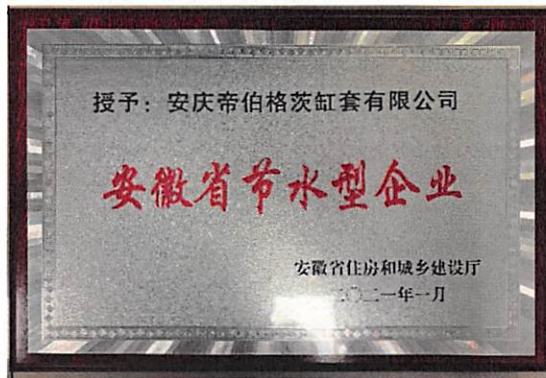
安徽省节水型企业